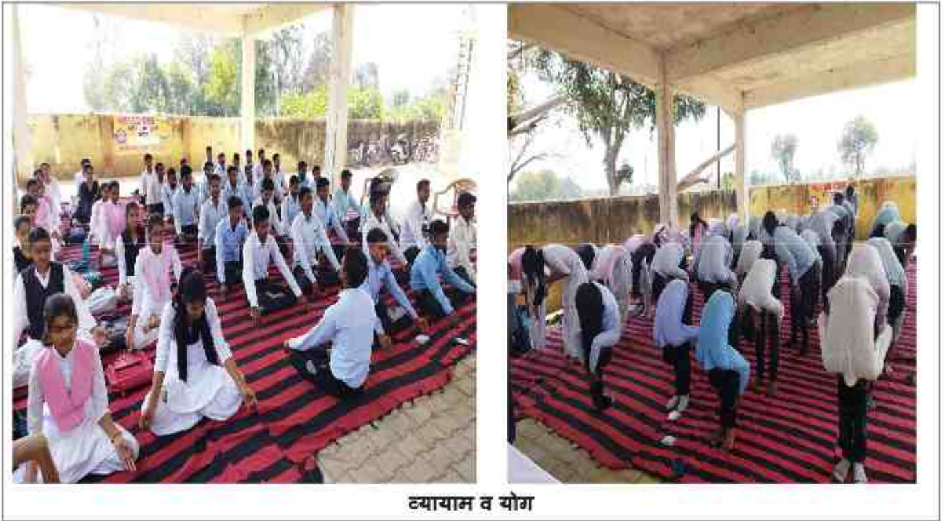
व्यायाम व योग