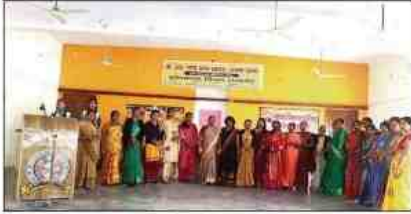
महिला दिवस आयोजित हुआ कार्यक्रम

स्वावलंबन से जुड़ी महिलाओं को किया सम्मानित