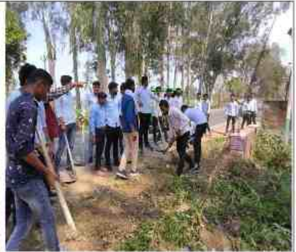
बृहद स्वच्छता अभियान