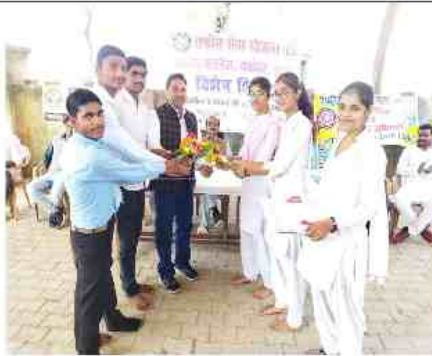
स्वयंसेवकों ने कार्यक्रम अधिकारी को पुष्प देकर सम्मानित किया