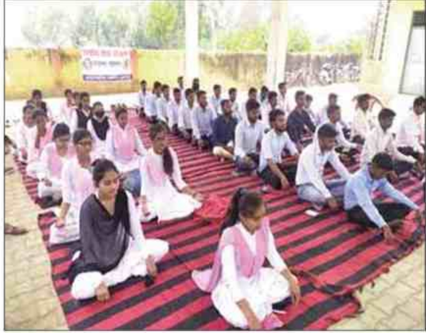
प्राणायाम करते छात्र-छात्राएं।