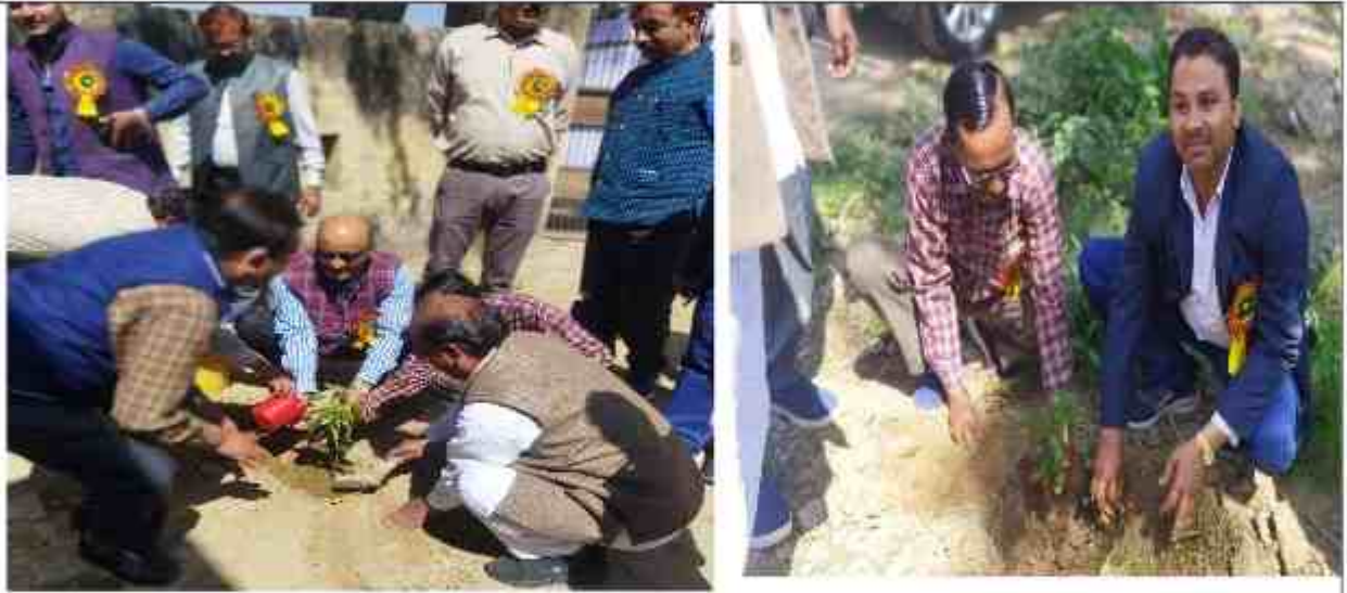
अतिथियों ने वृक्षारोपण करके विशेष शिविर का किया शुभारंभ