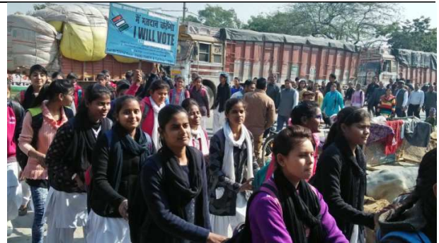
Rally for vote awareness and rights