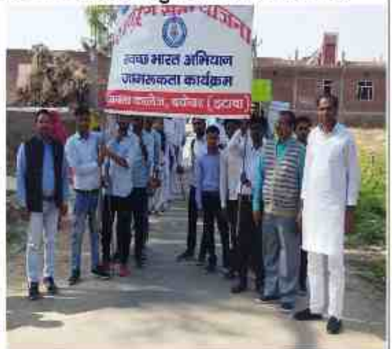
स्वच्छता जागरूकता लाने के लिए स्वच्छता रैली