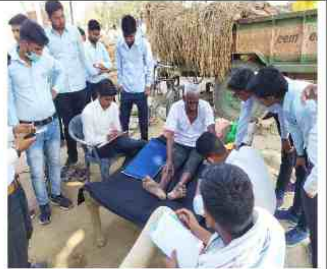
स्वयंसेवकों ने गांव के इतिहास, कृषि, शिक्षा तथा रोजगार व व्यवसाय के बारे में सर्वेक्षण किया।