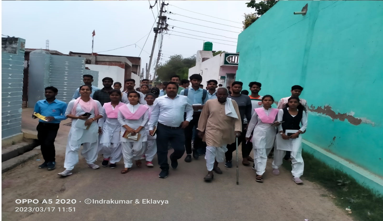
OPPO A5 2020 · ©Indrakumar & Eklavya 2023/03/17 11:51