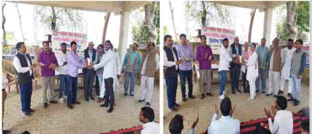
श्रेष्ठ स्वयंसेवकों को शील्ड देकर सम्मानित किया