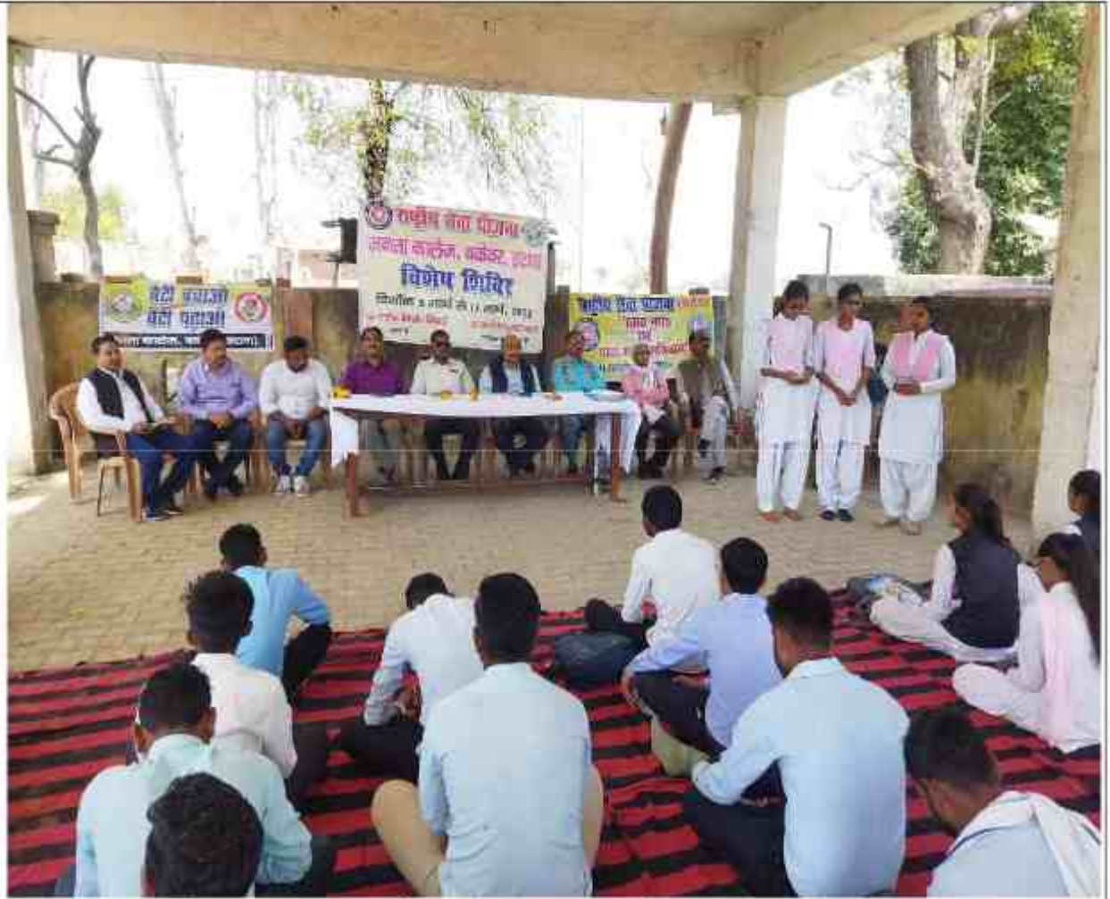
कार्यक्रम के समापन सत्र में अतिथि