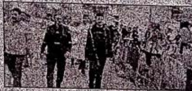
बकेवर: मतदाता जागरूकता रैली निकालते लोग।

बकेवर (एसएनबी)। जनता कालेज बकेवर की राष्ट्रीय सेवा योजना इकाई द्वारा ग्राम बल्लनपुर में खुलाए जा रहे सात दिवसीय विशेष शिविर के पांचवें दिन ग्रामवासियों को मतदाता के प्रति जागरूक करने के उद्देश्य से एक