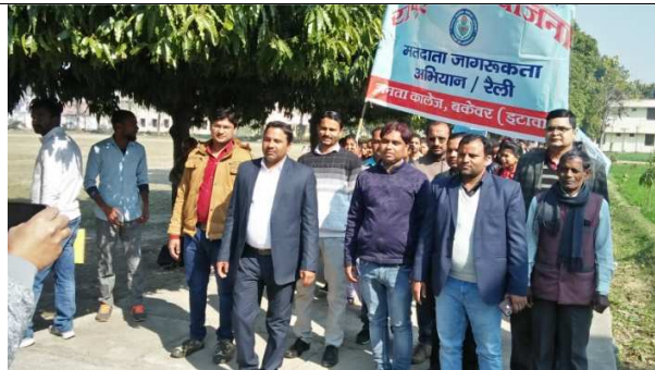
Rally for vote Rights