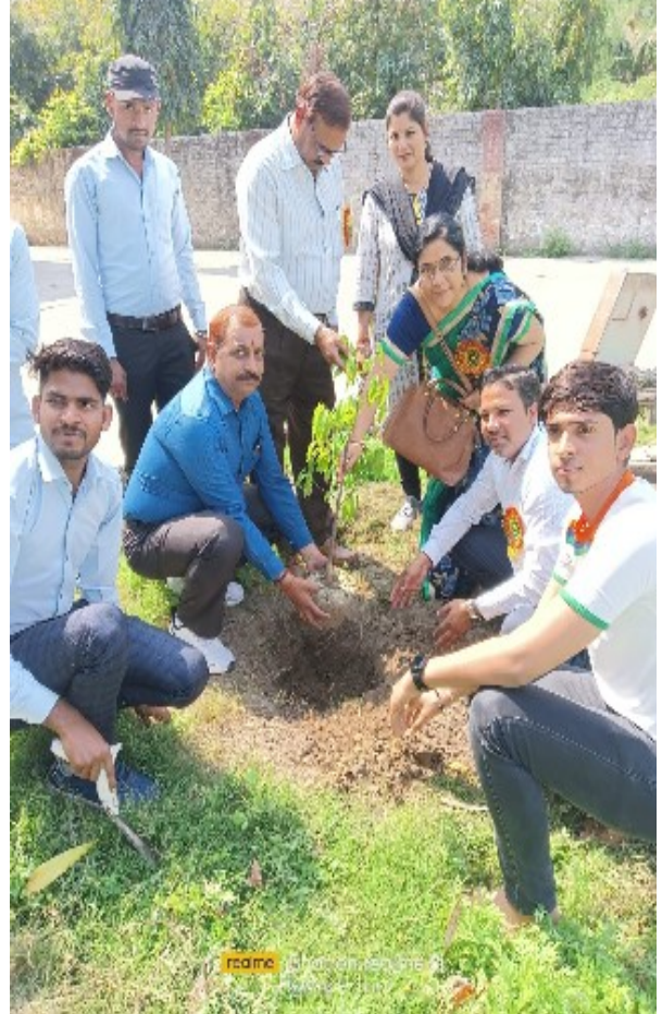
मय माडर्रा का प्ररररा का कषा उ कषा मर्रा