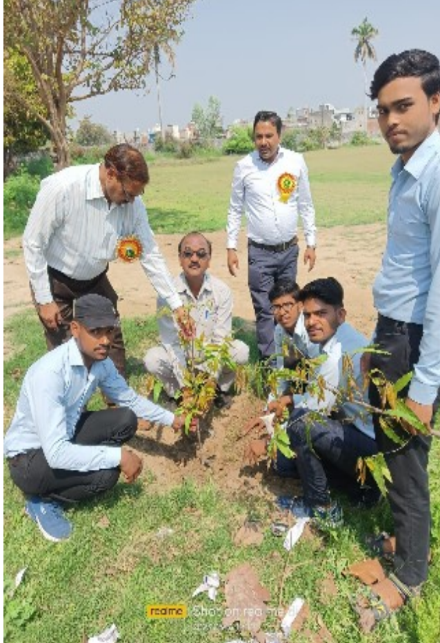
उदर्र झासा साहब तमाम प्रदर्रर का जलता म एव काररकता उपररररत रह