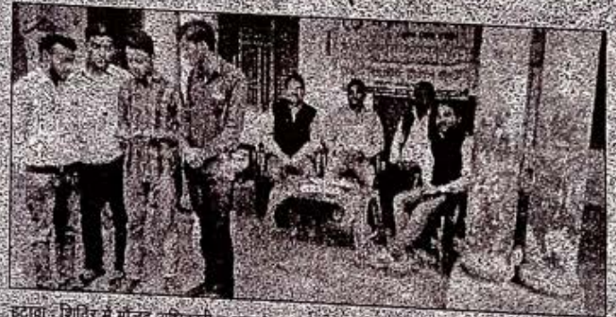
इटवा शिविर में मौजूद अधिकारी व अन्य।