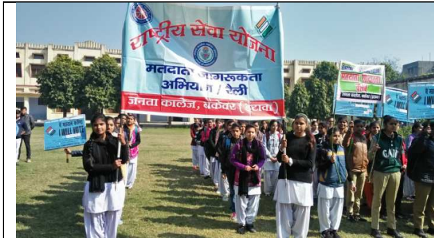
Student Rally start after green flag of principal