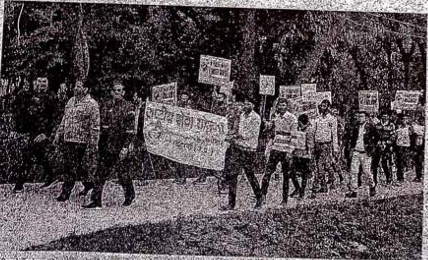
राष्ट्रीय सेवा योजना के छात्रों ने मतदाता जागरूकता रैली निकालते हुए