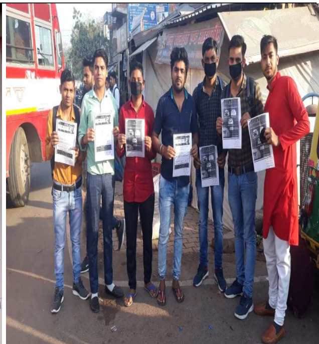
NSS Volunteers awarding to people against Covid-19