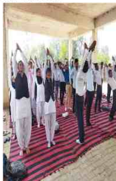
व्यायाम व योग करते हुए स्वयं सेवक