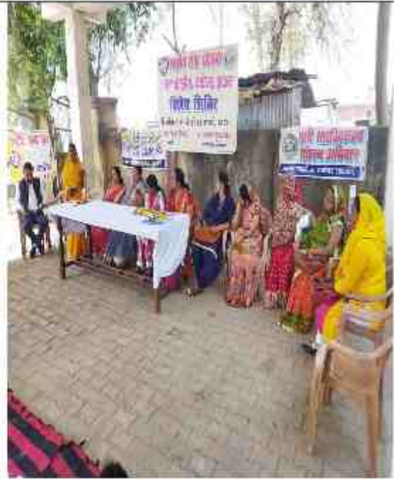
अंतरराष्ट्रीय महिला दिवस कार्यक्रम में क्षेत्र की उद्यमिता एवं समूह के पदाधिकारी महिलाओं को सम्मानित किया गया