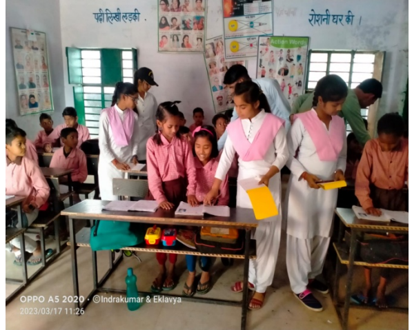
OPPO A5 2020 · ©Indrakumar & Eklavya 2023/03/17 11:26