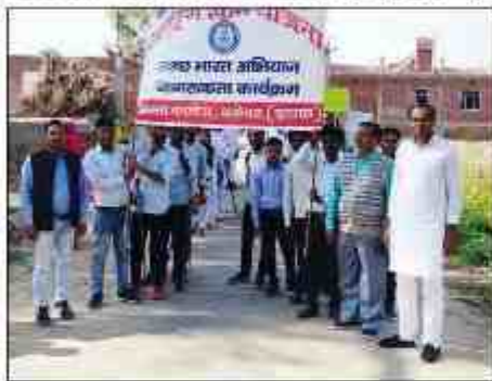
अभिियान का शुभारंभ

इलाहाबाद, 28 अक्टूबर : स्वच्छता के प्रति नगर के लोगों को किया गया जागरूक करने के लिए नगरपालिका के द्वारा एक कार्यक्रम आयोजित किया गया। कार्यक्रम में नगरपालिका के अधिकारियों, नगर के लोगों और स्वयंसेवकों का भाग लेना शामिल था। कार्यक्रम में नगरपालिका के अधिकारियों ने लोगों को स्वच्छता के प्रति जागरूक करने के लिए नगरपालिका के द्वारा एक कार्यक्रम आयोजित किया गया। कार्यक्रम में नगरपालिका के अधिकारियों, नगर के लोगों और स्वयंसेवकों का भाग लेना शामिल था।