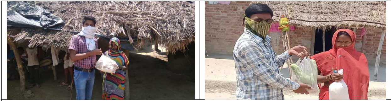
Ration distributed by NSS volunteer