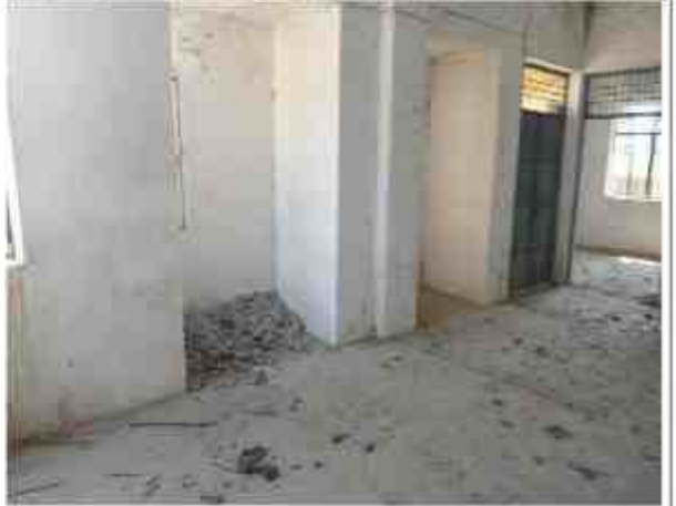
विशेष शिविर लगाने के पहले की छायाप्रतियाँ