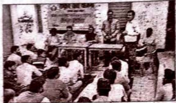
विद्यार्थियों में स्वयंसेवकों को संबोधित करते कार्यक्रम अधिकारी।

बुधवार, 27 फरवरी, 2019, 06:04PM, 11th Issue, 21 Ekaadhi, Itawa Ekaadhi