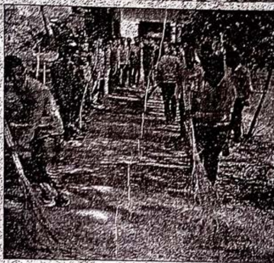
सफाई कार्य में जुटे छात्र।