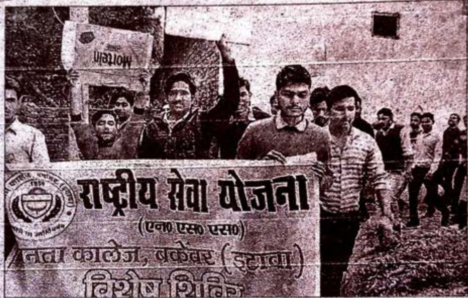
राष्ट्रीय सेवा योजना के छात्रों ने जुलूस निकालकर ग्रामीणों को जागरूक किया। अमर उजाला