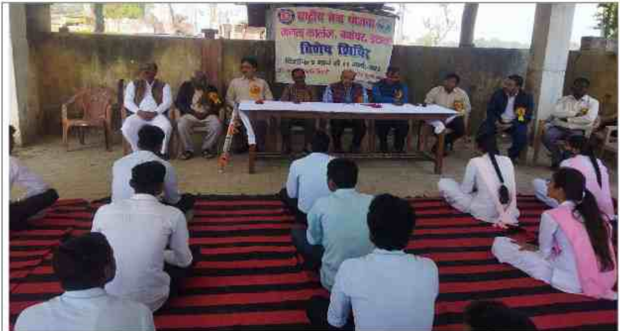
उद्घाटन सत्र में कार्यक्रम के अध्यक्ष तथा कार्यक्रम के अतिथि