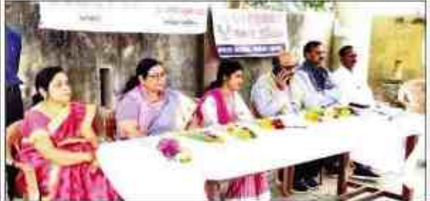
स्वावलंबन से जोड़ने वाली महिलाओं को सम्मानित करती।