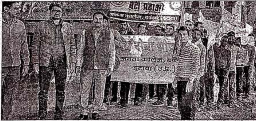
जागरूकता रैली निकालते एनएसएस के स्वयंसेवक।

बकेवर। जनता कालेज की राष्ट्रीय सेवा योजना इकाई द्वारा अंगीकृत ग्राम बल्लमपुर में चलाए जा रहे सात दिवसीय शिविर के तीसरे दिन स्वयंसेवकों ने एड्स जन जागरूकता रैली, बेटी बचाओ-बेटी पढ़ाओ व महिला सशक्तिकरण रैली का आयोजन किया गया।