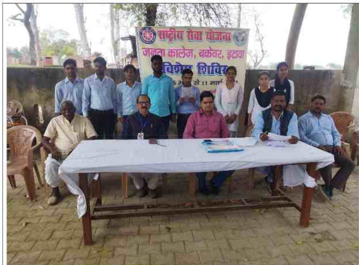
स्वयं सेवकों को उनके कर्तव्यों के प्रति जागरूक होने के लिए प्रेरित किया