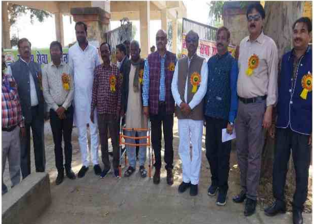
कार्यक्रम के अध्यक्ष तथा कार्यक्रम के अतिथि