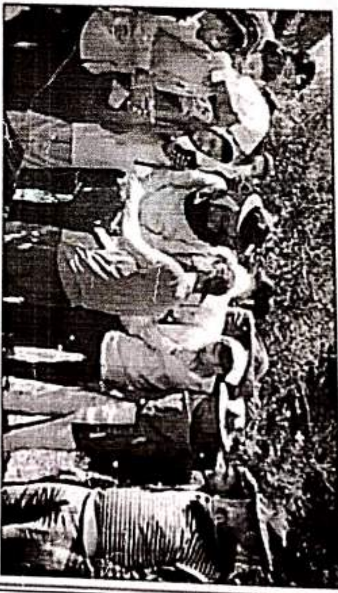
अनारज कर्मचारी के कृषि सभाक पंचम सेनेटर के छात्र-छात्राओं को दिया गया परीक्षण। मधुमक्खी

एकके बर्षस में एक टन राजसूत, 100-200 मर (रुपये) राजसूत मिलकर बर्षससह मिले है। बर्षसक बर्षससह का कार्य करार एकत्र करना, छात्रों को राजसूत करना, छात्रों व बच्चों के भीजन को बर्षससह करना होता है।